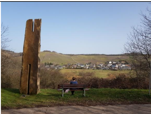
3 Skulptur, Blick ins Konzer Tälchen