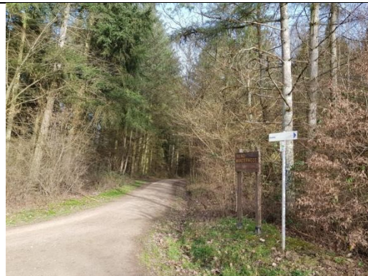
6: Am Wanderparkplatz rechts halten