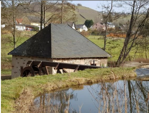
1: An der Ölmühle

Um die Mühle vor dem Verfall zu retten, wurden ab 1990 Maßnahmen zu ihrer Wiederherstellung ergriffen. Weitere Informationen enthält die Info-Tafel bei der Mühle. Auf dem Gelände befinden sich außer der Mühle noch eine Finnenbahn, ein Bouleplatz sowie eine Grillhütte.