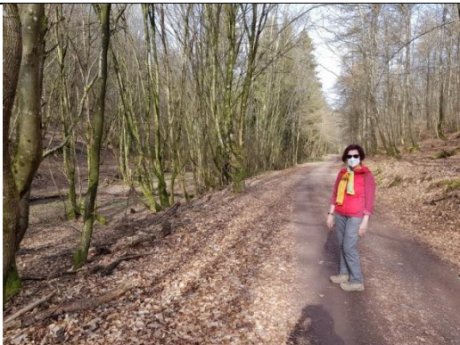
5: Unterwegs auf dem Mühlenwanderweg