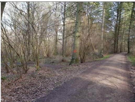
7: links geht es zurück zur Ölmühle