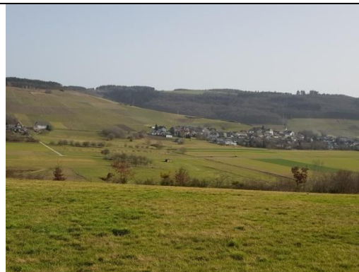
4: Blick ins Konzer Tälchen