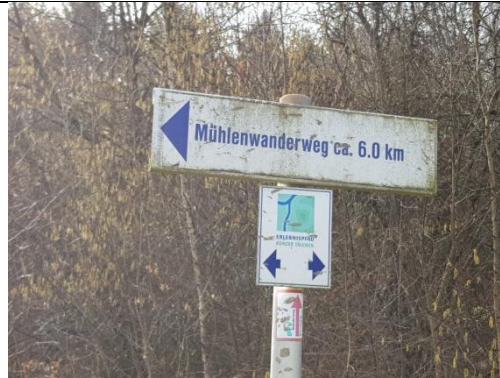
2: Diesen Schildern folgen