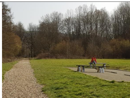
8: Boule- und Finnenbahn